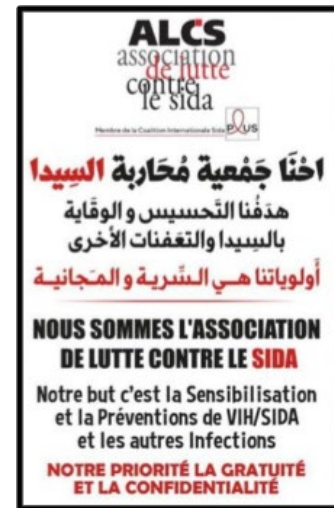
Photo de profil utilisée par l'ALCS sur les applications de rencontre

L'approche communautaire , grâce à ces acteurs·rices et ses codes, permet vraiment de créer cette atmosphère de confiance, de respect et de discussion.